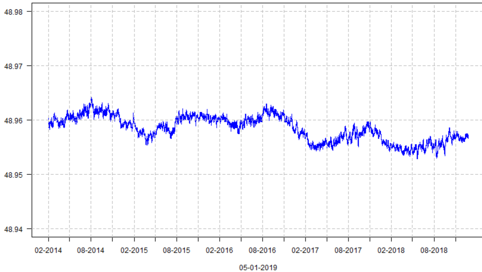
ETRS89 height (m) - GRK